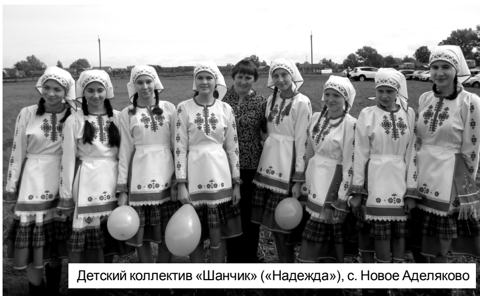
Детский коллектив «Шанчик» («Надежда»), с. Новое Аделяково

Николай МЕРКУШКИН: «Только всеобщее единение, межнациональное согласие и взаимопонимание могут стать основой сильного государства»